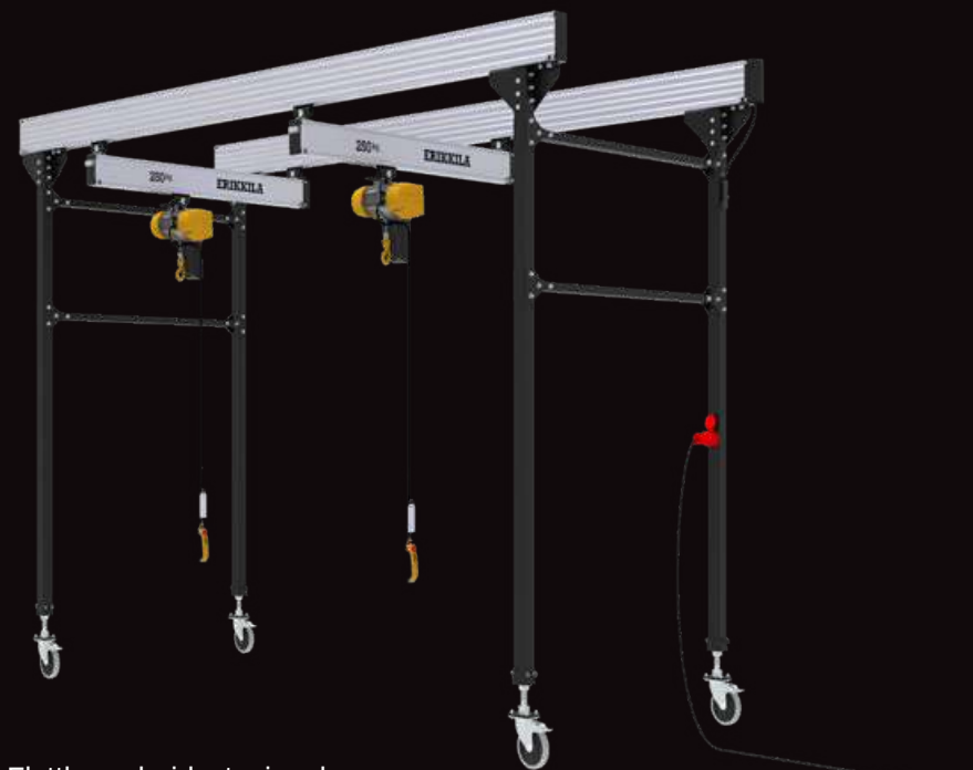
Flyttbar arbeidsstasjonskran (to traverser)