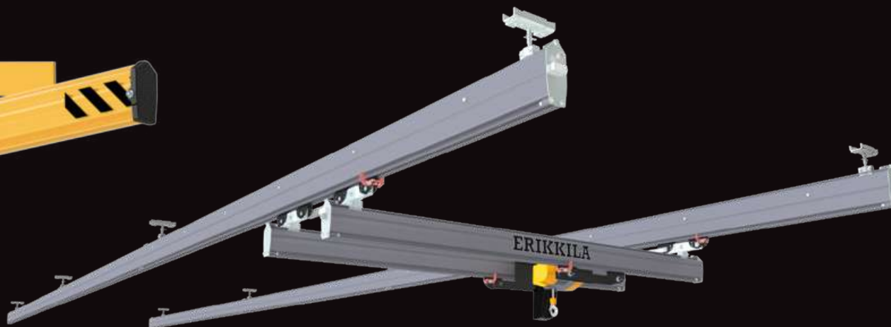
Dobbeltraverskran (stål, travers & bane)

Svingkraner er allsidige og robuste løfteløsninger, med alternativer for vegg- eller søylemontering. Perfekte for produksjon, montering og vedlikehold – og integreres sømløst i de fleste lokaler.