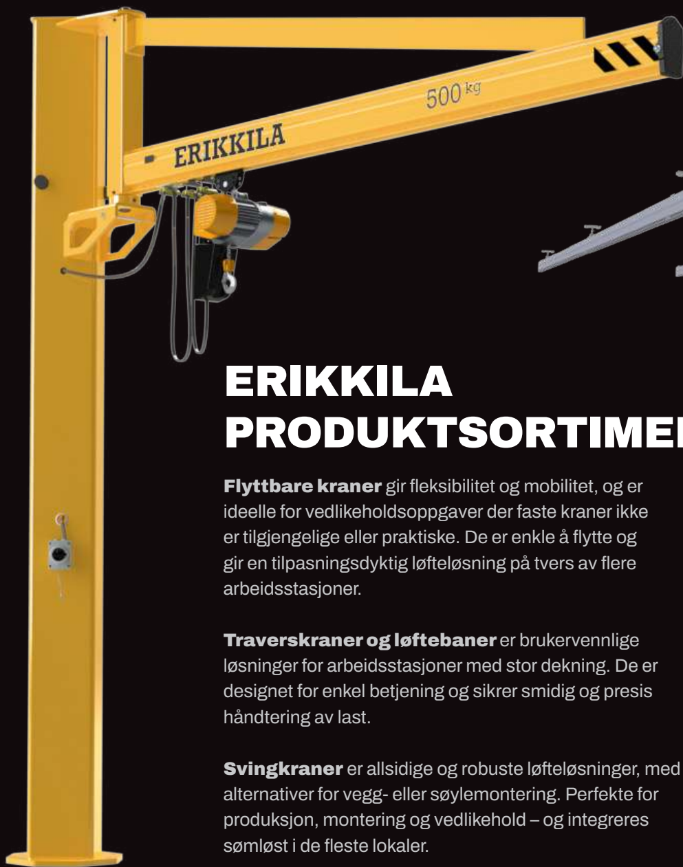
Søylesvingkran (forsterket stål)